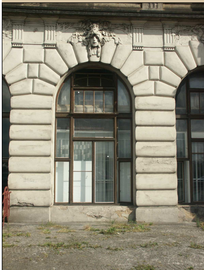
pohled na okno z exteriéru

1N.029-5 bude stávající okno nahrazeno dveřmi pro budoucí vstup po snížení úrovně terénu. Nově provedená křídla v kopii profilací se splněním požadavků těl. post. dle vyhl.398/2009Sb.příloha č.3 – vstupy do budov (š. křídla 800, madlo). Křídla budou uložena pro osazení při realizaci snížení úrovně terénu. Viz technologický postup TP/116, lepené sklo (bez nadsvětlíku).