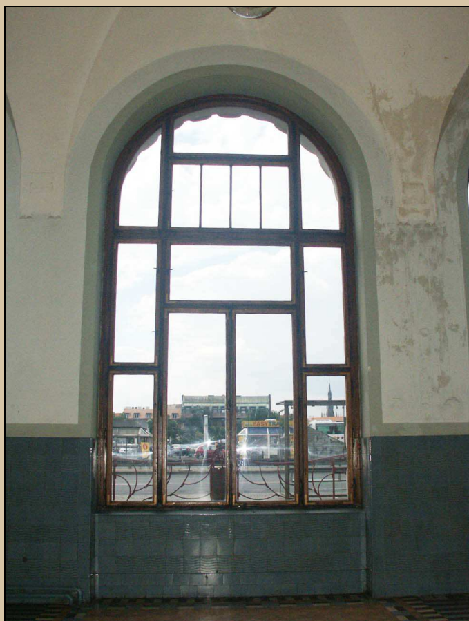
pohled na okno z interiéru