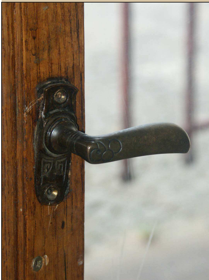
klička, původní secesní