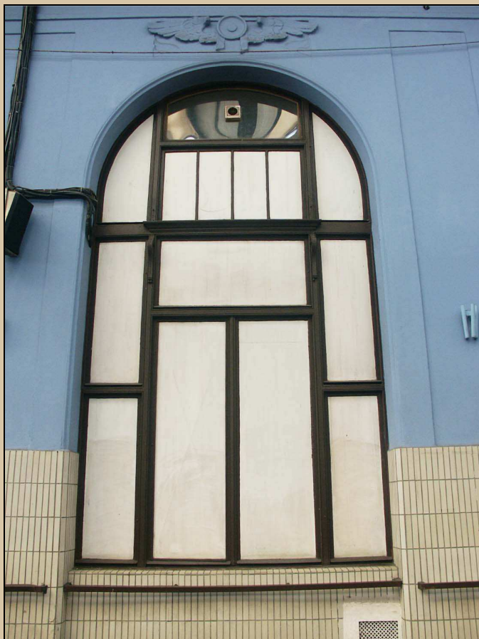
pohled na okno z perónu